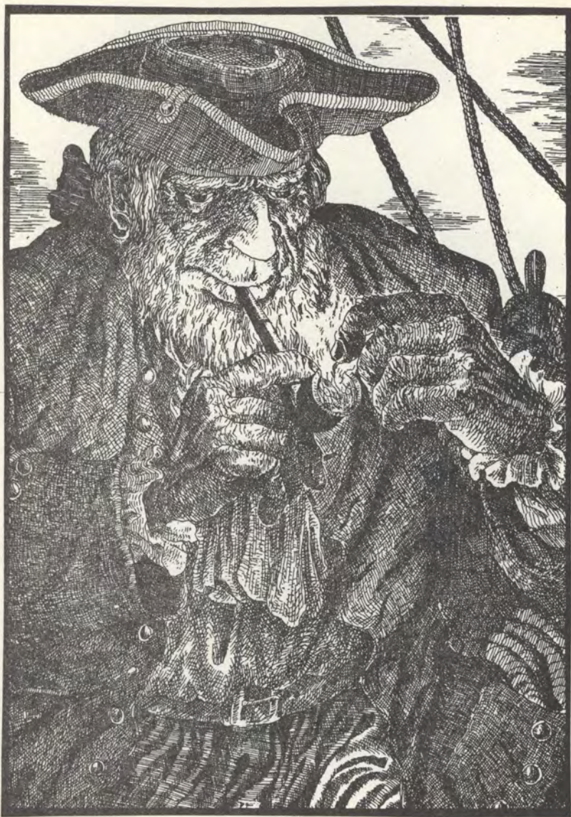
С. ЮКИН. Хельмут Ханке. На семи морях. Иллюстрация.