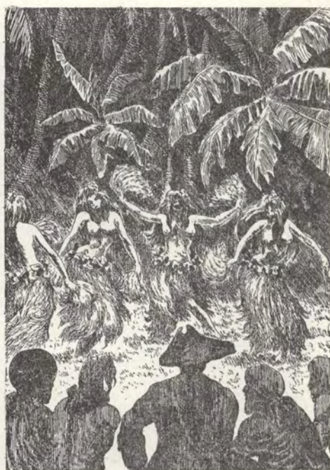
Хельмут Ханке. На семи морях. Иллюстрации.