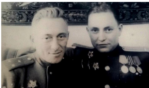
Встреча братьев в немецком городе Наумбург. Май 1945