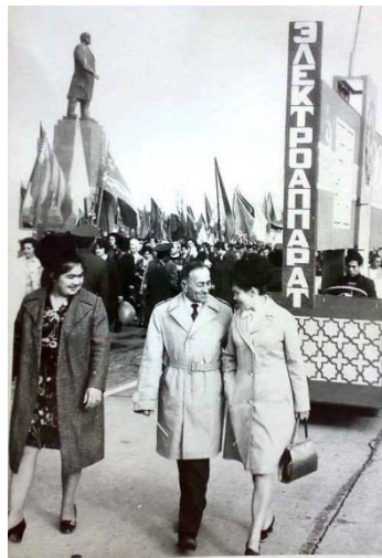
Отец во главе объединения на демонстрации

год специальность закрыли, и всю группу перевели в Казанский химико-технологический институт. После окончания она вернулась в Ташкент, но вскоре вышла замуж, и уехал в Самарканд - город, в котором родилась. Отец успешно продолжал директорствовать, и в середине 60-х годов по его инициативе завод был преобразован в НПО «Средазэлектроаппарат», первым Генеральным директором которого он и стал. Это было мощное предприятие с двумя заводами в Ташкенте, филиалами в Узбекистане, Таджикистане и Казахстане, с Научно-исследовательским институтом реле и автоматики, который также возглавил отец. Объединение выпускало