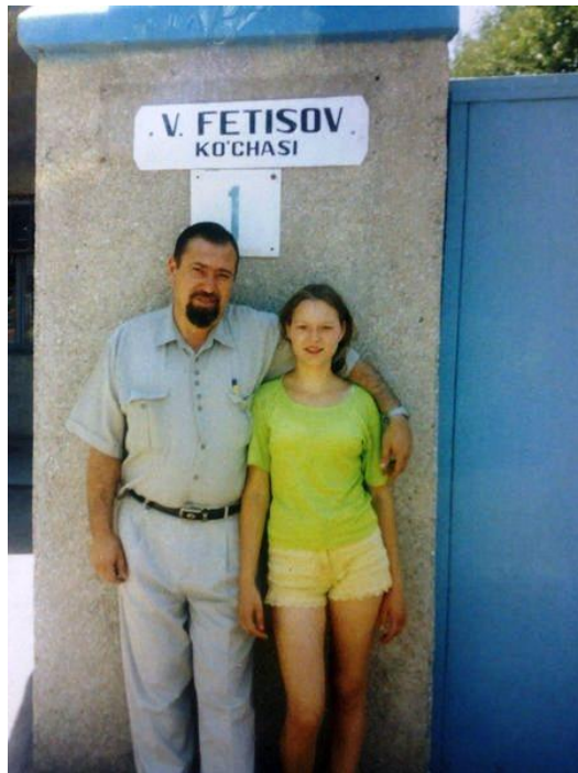
С дочерью у проходной завода

Жизнь продолжается, неукротимо течёт река времени - у меня у самого уже появились внуки и есть большой шанс стать в скором времени прадедом. Я сделаю всё возможное, чтобы мои потомки никогда не забыли тех, кто дал жизнь мне, а тем самым - всем им.