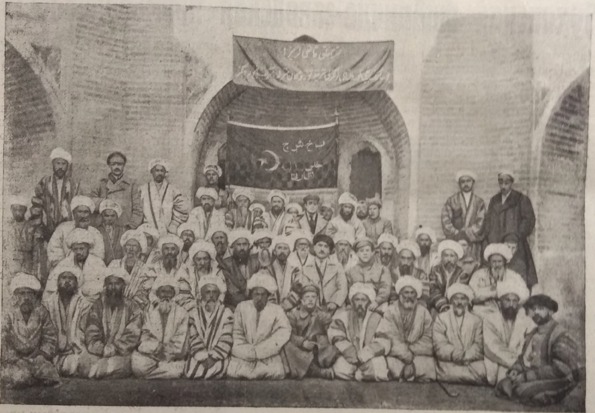
Аурутақ Юсуфзаданк عهدиде نازرلىكى واقىدا چاقراغان برنجى بوخار قازىلار قورولناينك وه كىلدرى.

были бы значительно удешевлены для широких декханских масс, если бы производство их находилось в самой Бухаре. Над этим вопросом надо серьезно поработать в надежде, что СССР пойдет в данном случае Бухаре навстречу. Мы имели в этом смысле возможность убедиться в его добром отношении. Правительство СССР передало правительству БНСР принадлежащую фабрику «Красный Восток», находящуюся в г. Зарайске. Эта фабрика пока еще не наладила своего производства, но с каждым днем положение дела на фабрике улучшается и можно надеяться, что с течением времени она будет обслуживать Бу-