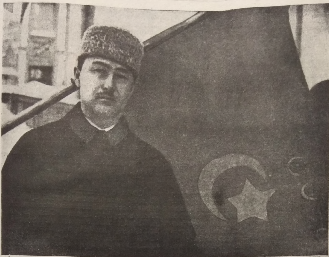
بوخارا خلق جومهورییه تیزانمه سکوده گی وه کیلی ئورتاق: عبدالرحیم یوسفزاده.

Полномочный представитель БНСР в Москве Абдурахим Юсуф-Заде.