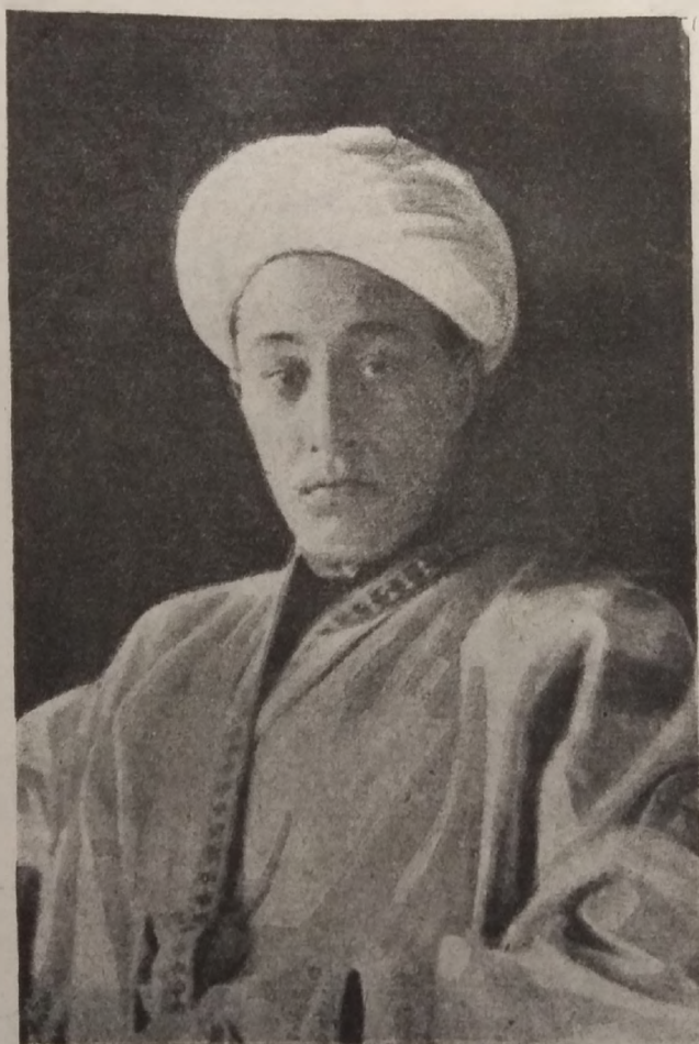
Бухара خەلق شوراىر جومھورييەتىنىڭ نازرلار شوراسى رەئىسى: اورتاق فەيزوللە حوجا.

Председатель Совета Народных Назиров Бухарской Народной Советской Республики Файзулла Ходжаев.