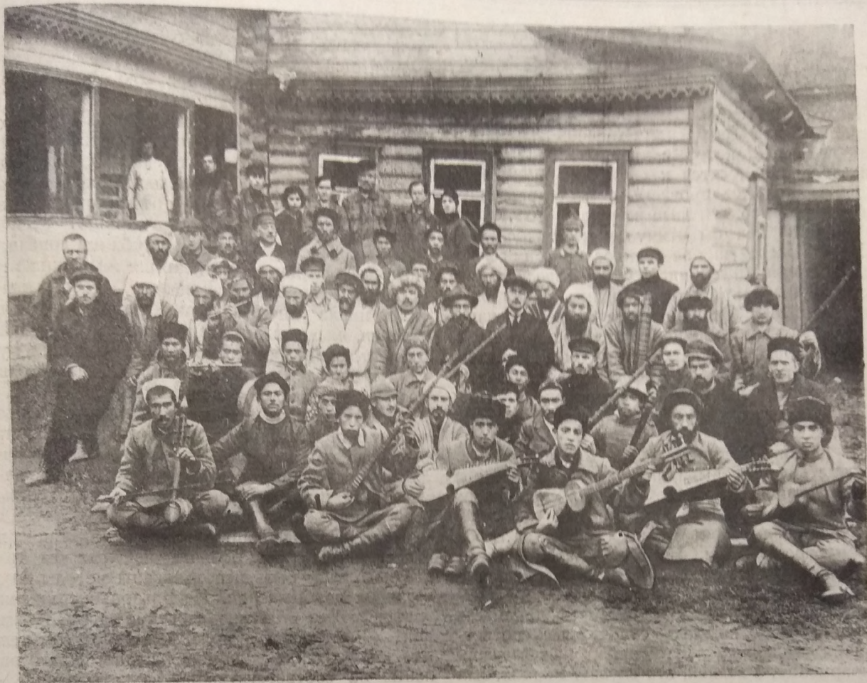
Бухара ٲيشچى — دهقانلار يدان مه سكه وده آچيلغان ويستد فكه گه كيلگن وه كيللەر.

Группа декхан и рабочих вилайатов Бухары.