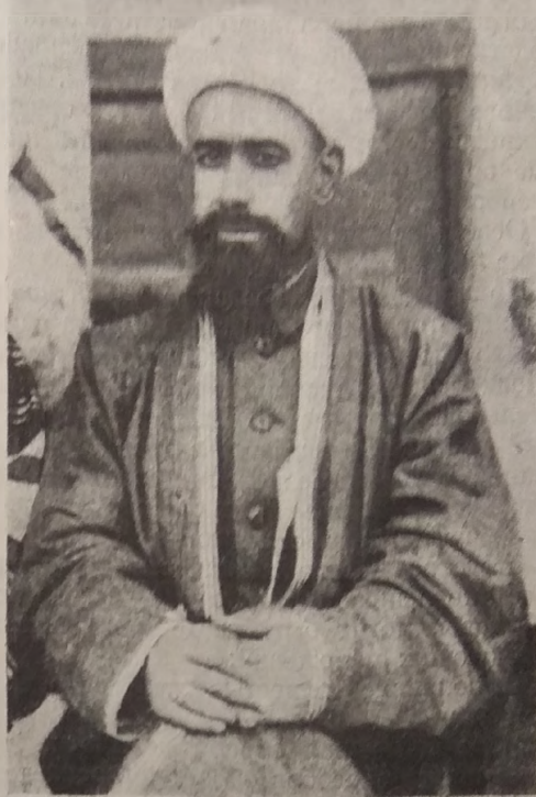
Бухара мотар кези ئيجرائيه قوميتيه سينك ره ئيس، اور تاق پارسا حوجا.

Здесь мы не будем детально останавливаться на роли и значении хлопководства в экономике страны и на необходимости его восстановления, так как вопрос этот в достаточной степени ясен.