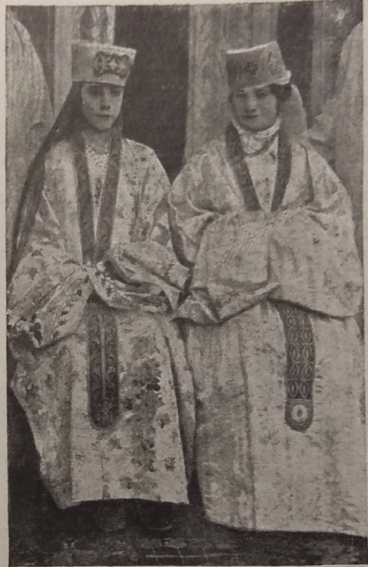
Бухара ҳатонларинк қорвиниши

фабрикатов декхани даст нам сырье, на которое имеется широкий спрос. Как, однако, способствовать тому, чтобы декхани имел возможность доставлять нам в соответствующем количестве это сырье? О кредите и о снабжении сельско-хозяйственными орудиями и семенами мы уже говорили. Но тут необходимы еще и другие серьезные мероприятия общегосударственного характера. К числу этих мероприятий, прежде всего, относится серьезная, постоянная и неослабная забота об ирригационной сети, которая все время должна стоять в центре советского внимания. Эта