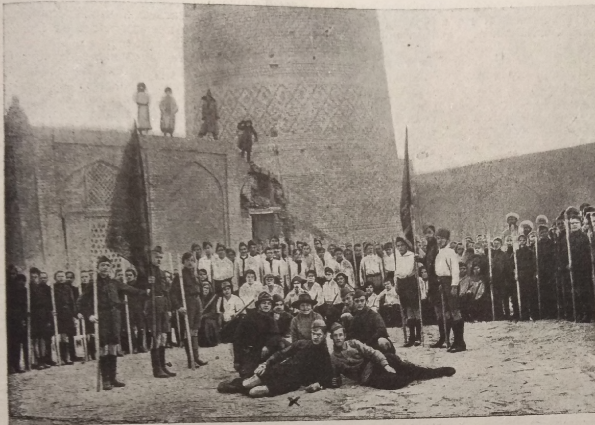
بوخارا ياش كىشىلەر بىرى بونچى ئۆتۈردى. لينين آتىگە آچلغان بتون بوخارا ياش كىشىلەر مىدرىسەسى مىر عەرب مەيدانىدا.