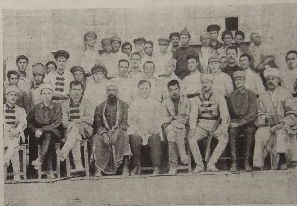
Международный день юности. Об'единенное заседание Комсомола, Правительства и Штаба Армии. БКСМ является штафом Бухарской Национальной Красной Армии.

3) По р. Даран-Ходжа—Оби-Гарм (приток р. Варозоб), по дороге с перевала Утали-Тяуб,