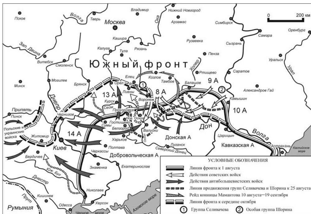
Южный фронт РСФСР в августе — октябре 1919 г.

ская война и военная интервенция в СССР», у Селивачёва было 49,7 тысячи штыков и 4,7 тысячи сабель, 268 орудий, 1 381 пулемет 123 . Однако перерасчет по данным о боевом составе дивизий и бригад группы на 15 августа 1919 г. дает гораздо меньшую численность — 40 066 штыков, 4 153 сабли, 235 орудий и 1 236 пулеметов 124 на фронте в 410 км.