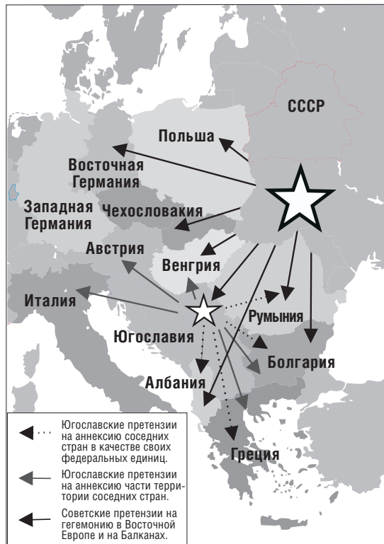
Схема пересечения претензий на гегемонию СССР и Югославии 1945–1948 гг.

Как только раскол со Сталиным получил огласку, широчайшие слои югославов из пассивных и апатичных наблюдателей политических событий превратились в сосредоточенные и заинтересованные массы. Это было следствием сильных националистических настроений в Югославии, которые ослабли после захвата власти коммунистами, но возродились, когда появилась возможность хоть что-то изменить. Угрозы и обвинения, исходившие от Советского Союза, имели в Югославии обратный эффект. Они