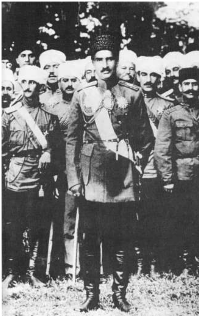
Реза-хан Пехлеви среди товарищей по дивизии

и гитлеровской Германии. Кроме того, между Советской Россией и Ираном были достигнуты договорённости о полных и равных правах на судоходство в Каспийском море.