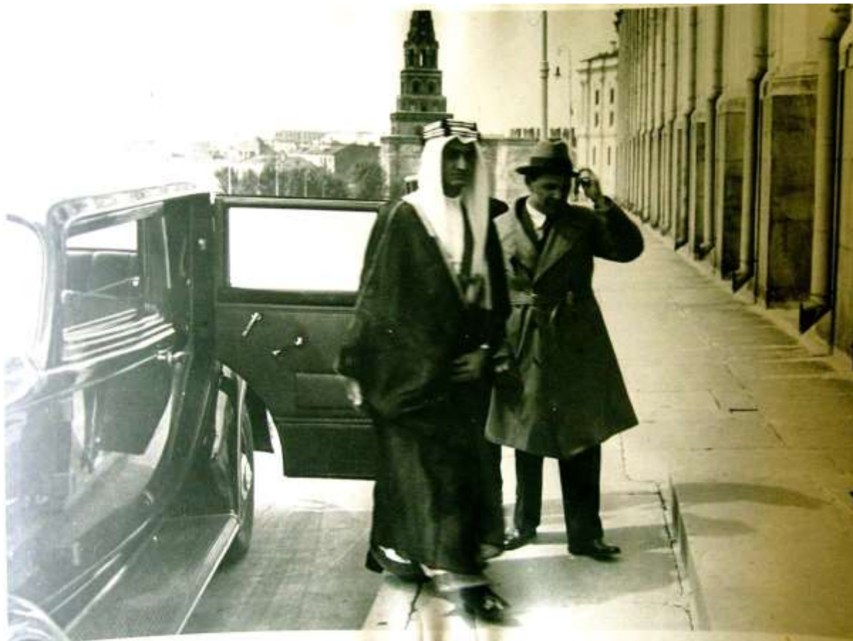
Принц Фейсал в Москве в сопровождении Карима Хакимова

В мае 1932 года в Москву, для встречи с главой советского государства Сталиным прибыл наследный принц Саудовского королевства – Фейсал бин Абдель Азиз ас-Сауд. Цель визита была получение кредита на миллион фунтов стерлингов сроком на 10 лет. Взамен Советскому Союзу предоставлялась концессия на разработку всех нефтяных месторождений на территории королевства. Перед визитом принц потребовал, чтобы в поездке по стране Советов его сопровождал Карим Хакимов и никто иной.