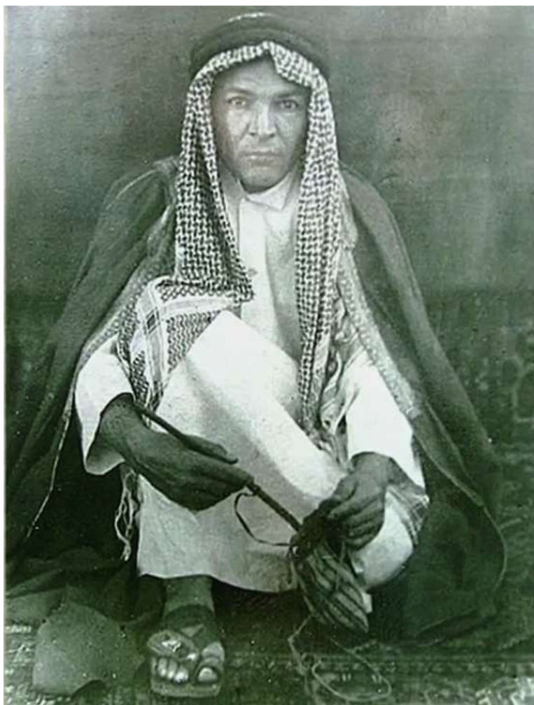
“Советский Лоуренс Аравийский” - Карим Хакимов

16 февраля 1926 года генеральный консул Советского Союза, облачённый в национальную одежду бедуинов выехал на автомобиле с советским флагом на капоте, рискуя жизнью проехал через охваченную войной пустыню до резиденции Ибн Сауда и вручил ему послание Кремля. В нём говорилось: "Правительство СССР, исходя из принципа самоопределения народов... признает Вас королем Хиджаза, султаном Неджда и присоединенных областей. В силу этого Советское правительство считает себя в состоянии нормальных дипломатических отношений с Правительством Вашего Величества". Советский Союз, таким образом, стал первым государством, признавшим нового короля Аравии. Ибн Сауд благосклонно отнёсся посланию Москвы и в ответной ноте выразил "полную готовность к отношениям с правительством СССР и его гражданами, какие присущи дружественным державам".