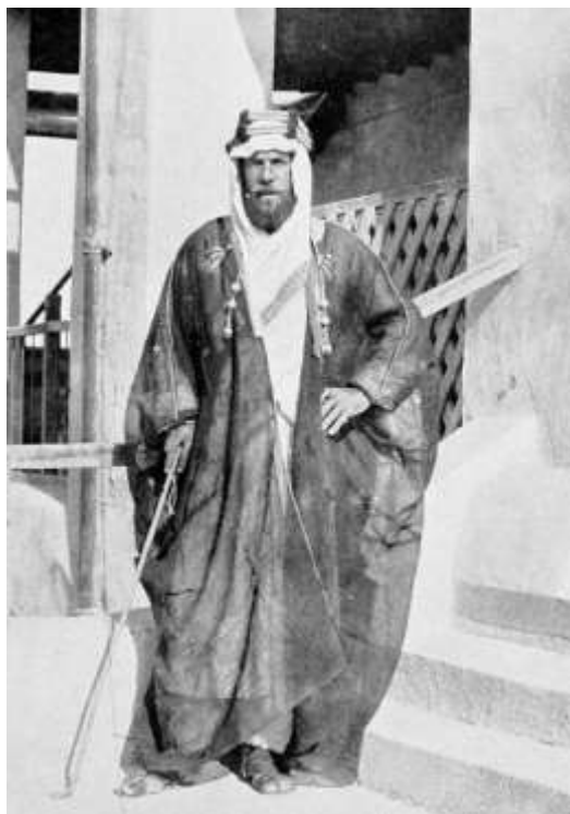
Шейх Абдалла (Джон Филби)