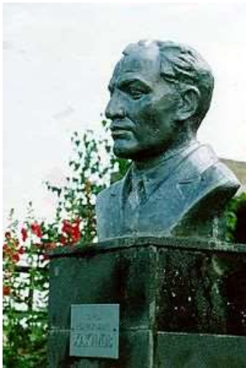
Бюст К. А. Хакимова в селе Дюсяново

Но, думаю, великая и трагическая судьба дипломата, разведчика, истинного сына России Карима Абдурауфовича Хакимова ещё ждёт своего воплощения в книгах, пьесах и фильмах.