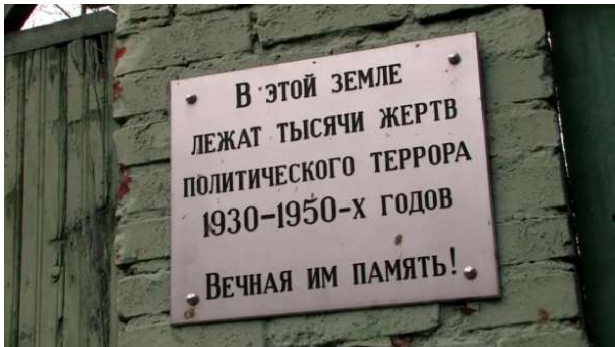
Памятная доска на полигоне “Коммунарка”

Карим Хакимов был обвинён в связях с английской разведкой и 10 января 1938 года расстрелян на печально известном полигоне “Коммунарка” под Москвой. Вместе с ним был казнён и его преемник Назир Тюрякулов.