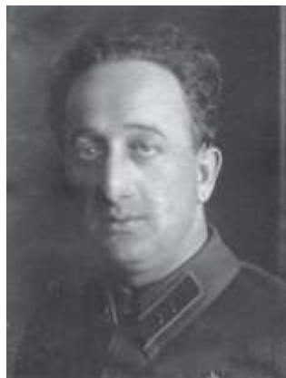
Фельдбин (генерал Орлов)

Георгия заманивают на явочную квартиру - якобы для получения инструкций и маршрута, по которому должна пройти контрабандная партия драгоценностей. В номере его ждали двое. Едва войдя и взглянув на ожидавших его людей, он понял, что угодил в ловушку. В одном из них узнал своего агента, завербованного в Стамбуле. Он и вогнал нож в сердце предателя. Затем тело убитого затолкали в чемодан, и, дождавшись ночи, выбросили в реку.