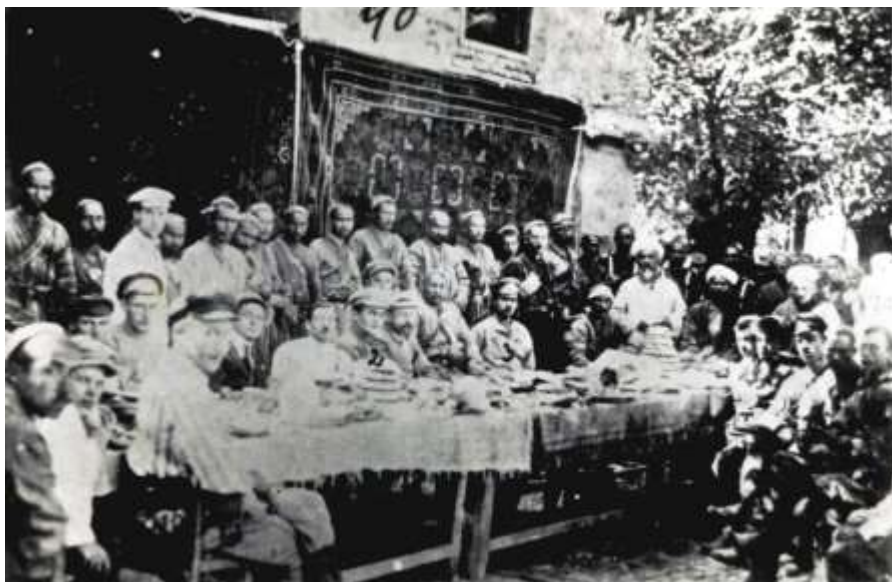
Н.Тюракулов на мирных переговорах с лидерами басмачей.

На посту руководителя республики Тюрякулов пробыл недолго – до октября 1922 года. Но за это короткое время он проявил себя настоящим лидером и умелым администратором.