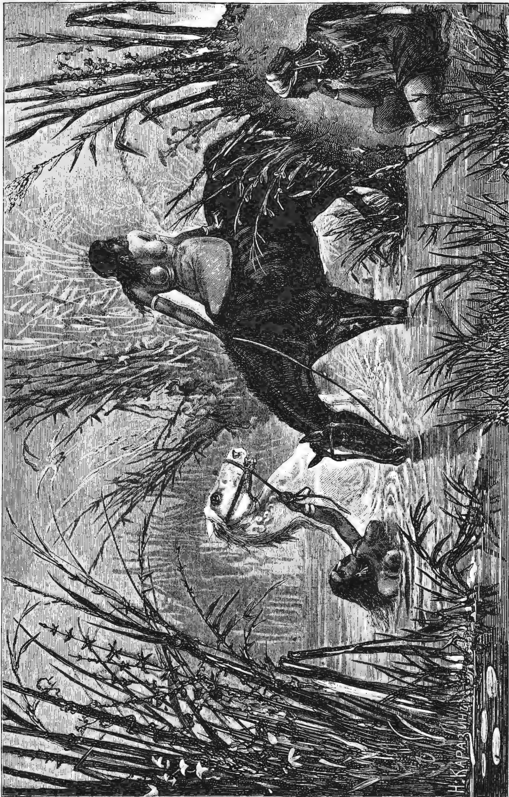
Тюрьменни, купающія лошадей. Оригинальный рисунок Н. Каравича, грав. К. Вейерманнъ.