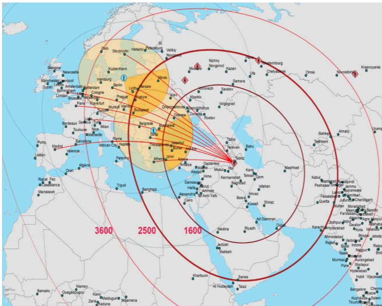
Рисунок Виталия Каберника.

Вот для примера карта с дальностями относительно одного «города ракет» недалеко от г. Тебриз. Радиусы досягаемости конкретных типов не указаны, сопоставьте сами.