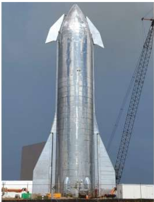
Ракета Илона Маска Starship-10

Довольно смешно на такой крупной ракете выглядят аэродинамические рули. Не её ли копировал Илон Маск в своих Starship?