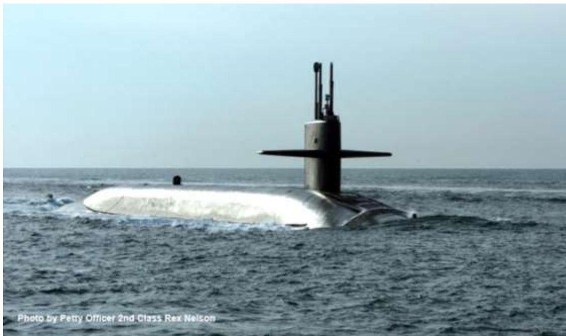
Фото в свободном доступе. Автор указан на фото.

Неизвестно какова мощность израильских боеголовок для ракет Иерихон-2/3. Но если первыми будут наносить удар американцы, то скорее всего они используют не шахтные МБР Минитмен-3, а ракеты подводных лодок (БРПЛ) Трайдент-2 Д-5.