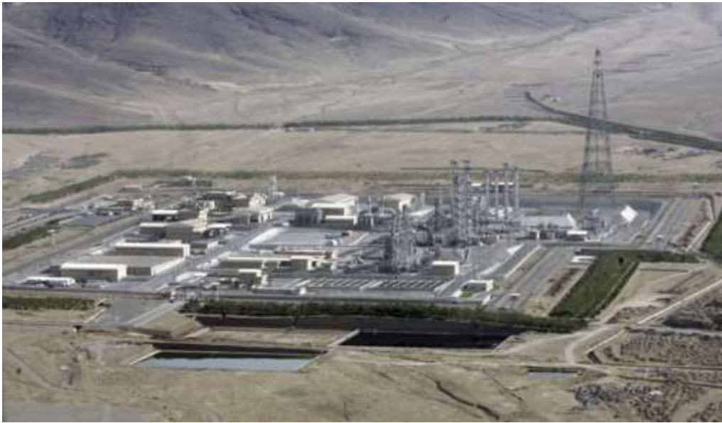
Общий вид ядерного центра (завода) по обогащению урана Натанз.

Например, вот на фото ядерный завод в Натанзе. На поверхности находятся цеха по производству центрифуг, химический цех по производству гексафторида урана, площадки хранения его и исходных материалов, энергетика, административные и служебные здания и пр. Всё это можно сдуть одной сверхтяжёлой бомбой GBU-43. Если силы ПВО Ирана позволят её носителю приблизиться на дальность сброса. Или парой десятков других калибром поменьше. Но всё это можно и относительно быстро восстановить.