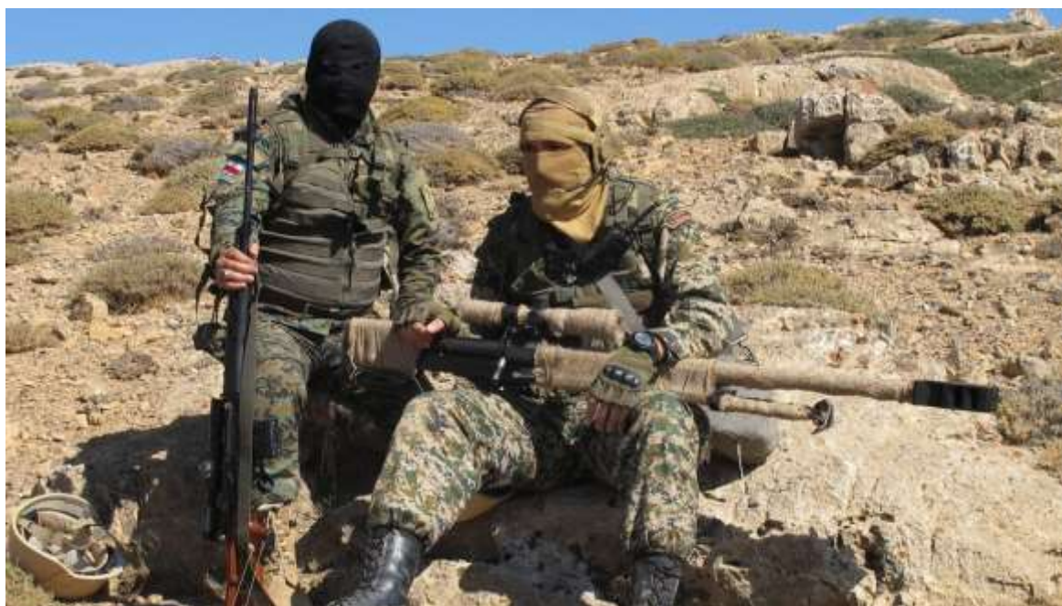
Снайперы сил Аль-кудс на тренировке.

В Сирии могут с большой вероятностью оказаться, может быть даже уже есть, иранские тактические ракетные комплексы Фатех-110, Фатех-313, Ормуз с дальностями 200-250 км и беспилотники. Не зря же Израиль так тщательно бомбит аэропорт Дамаска. Как садится борт из Ирана, так через 10 минут взлетают F-16I Sufa с бомбами GBU-39. Но борта вплоть до входа в район аэропорта идут в режиме радиомолчания. Времени после радиоперехвата запроса разрешения на посадку для подъёма бомбардировщиков и атаки слишком мало, чтобы успеть поразить привезённое в момент разгрузки. Но его может быть достаточно для того, чтобы выкатить и замаскировать поодаль пусковую установку. И даже борт успеет улететь. Из Сирии и Армении также могут действовать иранские системы РЭБ, ДРГ спецназа. Иранский спецназ достоин отдельной темы. Есть целые дивизии и бригады в Армии и КСИР, министерстве информации, Отдельное командование спецназначения.