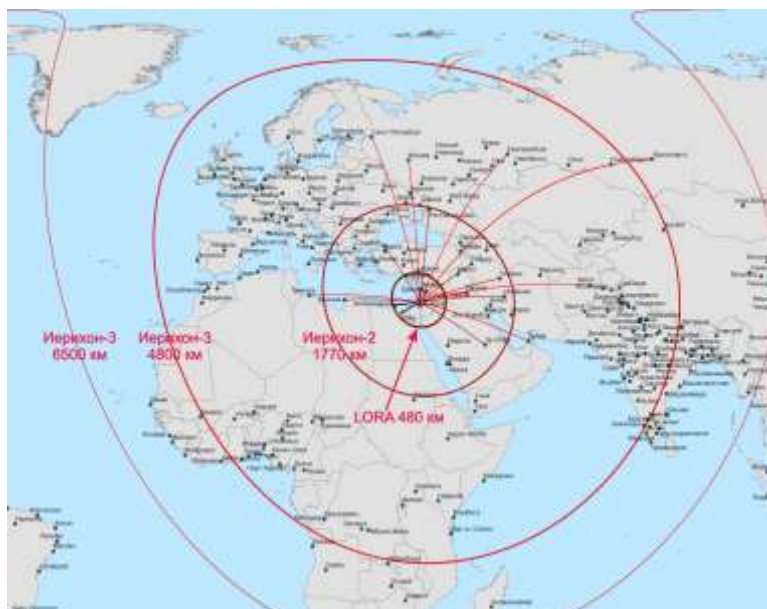
Рисунок Виталия Каберника. При перепечатке активная ссылка на данную публикацию обязательна.

Зона досягаемости израильских ракет. Для Иерихона 3 предположительная дальность указана при оснащении моноблочной ядерной БЧ.