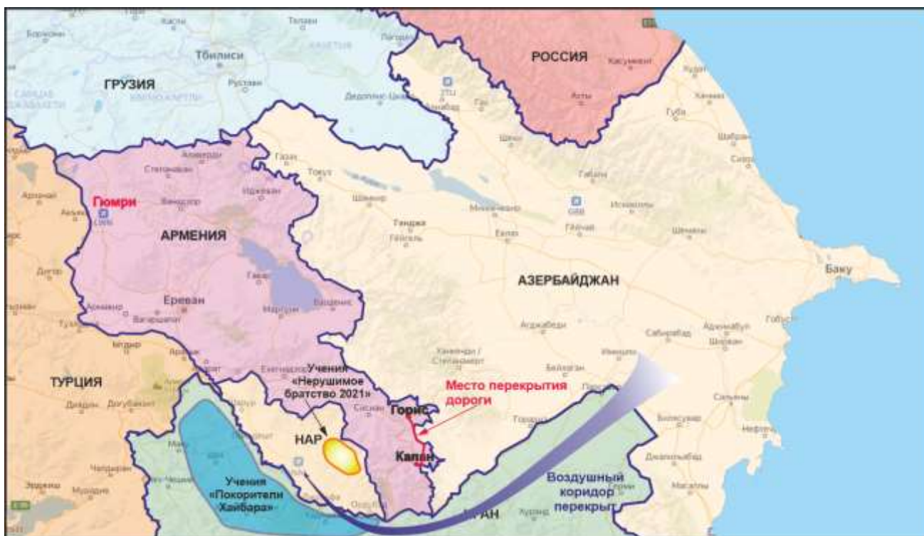
Рисунок автора. При перепечатке активная ссылка на публикацию обязательна.

страна может провести любые военные учения на своей территории. Это её суверенное право. Но почему сейчас и почему на нашей границе?» Большой, уважаемый человек разыгрывает из себя невинную овечку. А ведь прекрасно знает, что это его вооружённые силы создали повод для обострения отношений. Речь идёт о перекрытии азербайджанцами дороги между армянскими городами Горис и Капан (см карту), ареста двух иранских водителей и взимание пошлины и налога (ок. 100$) за проезд. Но это повод, а причины обострения, конечно, глубже.