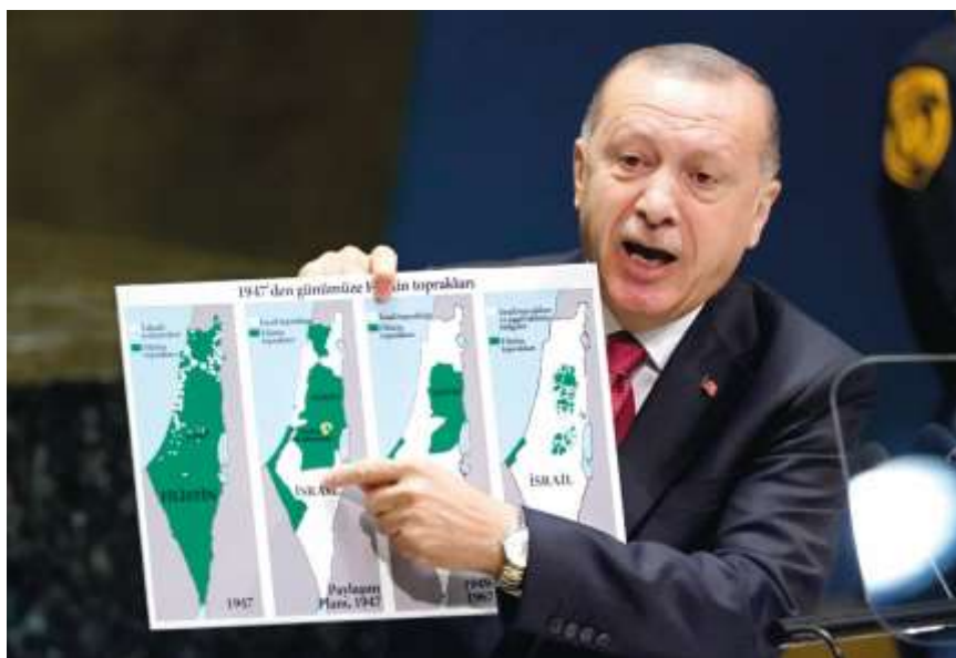
Фото в свободном доступе

С Ираном придётся взаимодействовать, несмотря на множество острых противоречий, особенно по палестинскому вопросу.