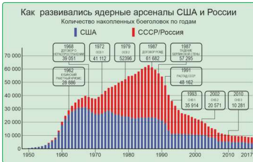
Рисунок В. Каберника и И.Галабурда При перепечатке активная ссылка на публикацию обязательна

современные дают меньшее радиоактивное заражение. А теория ядерной зимы создавалась в расчёте именно на те максимумы. Так что ни конца жизни на земле, ни даже ядерной зимы не будет. Это обман.