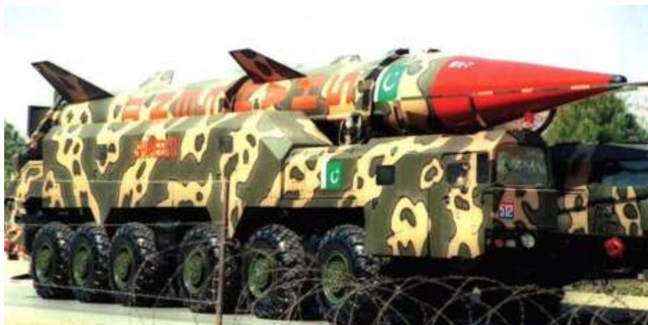
Фото в свободном доступе

боевые части его ракет представлены в основном урановыми одноступенчатыми зарядами. Это достаточно тяжелые устройства с мощностями в пределах первых десятков килотонн.