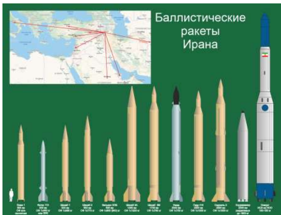
Рисунок И. Галабурда При перепечатке активная ссылка на данную публикацию обязательна.

Как заявил (в 2015) бригадный генерал Амир Али Гаджизаде, командующий Космическим флотом армии Стражей Исламской революции: - Иранские ракеты различной дальности готовы быть запущены из подземных баз, как только верховный лидер Ирана аятолла Али Хаменеи прикажет, сделать это. И добавил: - Иран создал ракетные базы во всех провинциях и городах по всей стране на глубине 500 метров.