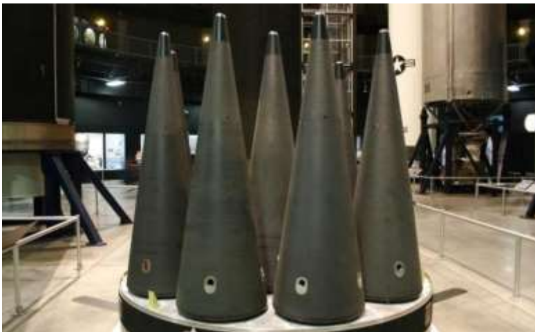
Фото в свободном доступе.

Эта ракета имеет разделяющиеся головные части: до 8 боеголовок W88 мощностью 475 кт или до 14 W76 мощностью 100 кт. Круговое вероятное отклонение -120 м. При максимальной нагрузке ракета способна забросить 8 блоков W88 на дальность 7838 км. То есть удар можно нанести из акваторий Тихого, Индийского и даже Атлантического океанов. По ракетным шахтам американцы планируют назначать по две боеголовки с разных ракет на одну цель чтобы повысить вероятность поражения. В случае с рассматриваемыми объектами это, наверное, не нужно. А вот по подземным «ракетным городам», которые, как хвастаются иранцы заглублены на 500 м в скалах, наверное, и двух будет мало.