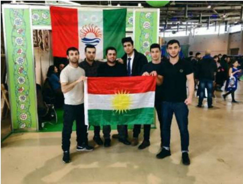
Фото в свободном доступе

Талыши- ираноязычный народ, проживающий на юге Азербайджана. Их численность в этой стране по неофициальным данным, достигает почти 2 млн. Многие из них являются жителями Баку и Сумгаита. Требуют независимости, правда не очень энергично.