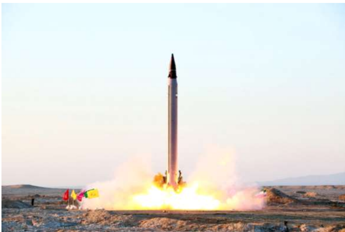
Фото в свободном доступе

Ракета Шахаб-3 на мобильной пусковой. Дальность полёта 1700км, высота до 400км, скорость падения боеголовки на конечном участке на высоте 10-30км - 2,4км/с, забрасываемая масса 1200кг