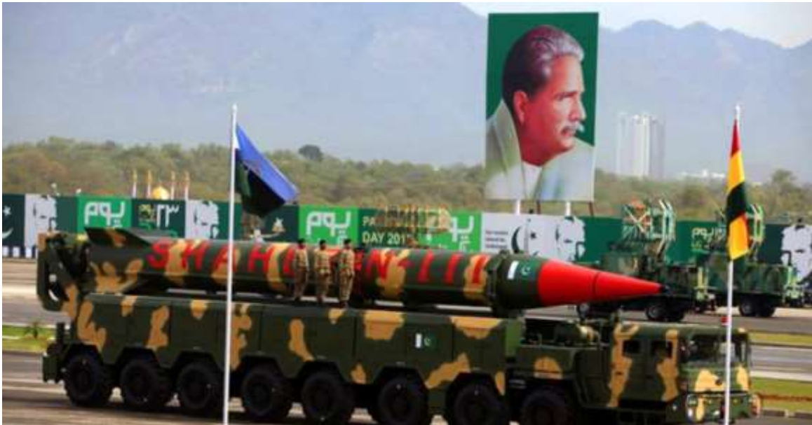
Фото в свободном доступе

БРСД "Шахин-3". Самая дальнбойная ракета Пакистана. На испытаниях была достигнута дальность около 2500 км