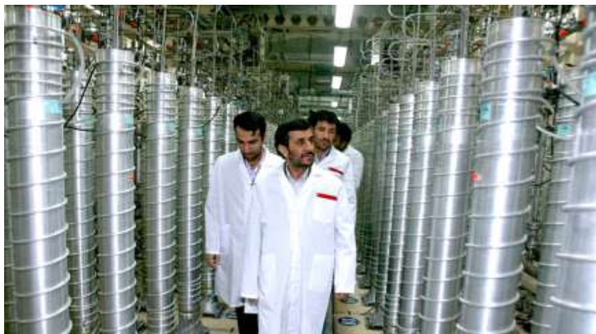
Фото в свободном доступе

«Банк центрифуг» Подземные залы с примерно 16,5 тысяч центрифуг на заводе в Натанзе. На этом фото центрифуги IR-2m