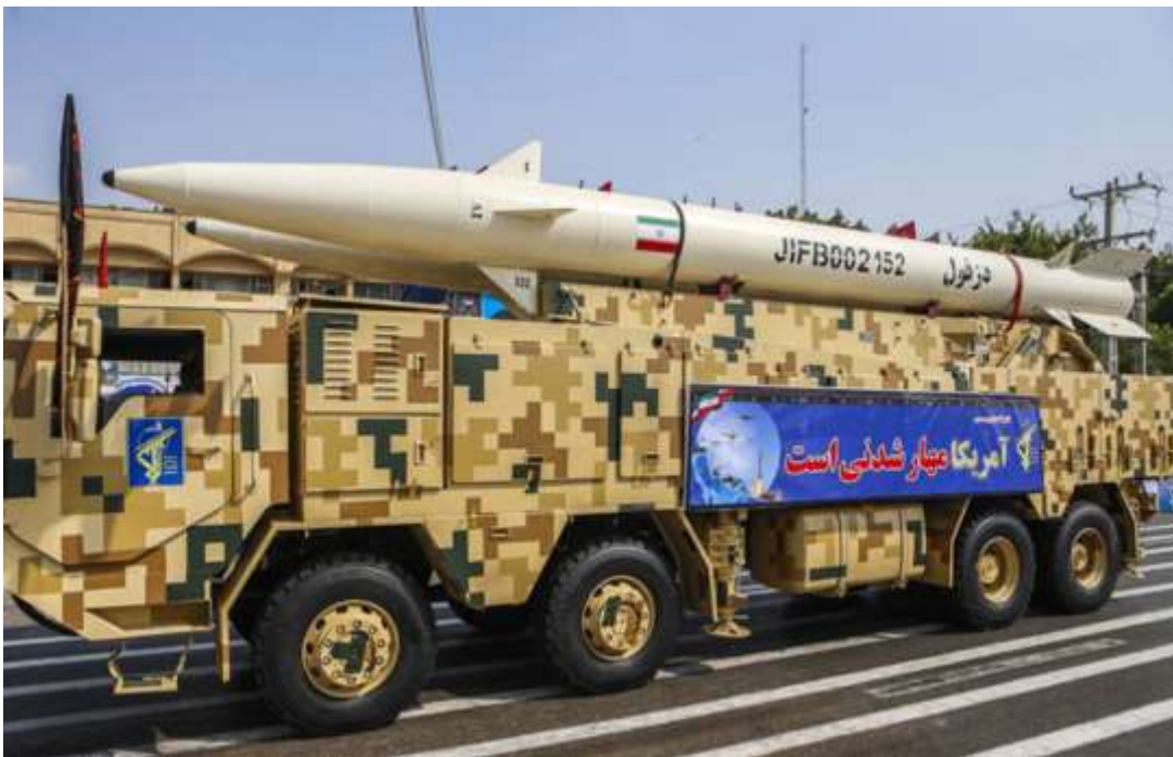
Фото в свободном доступе

БРСД Саджил-2 на мобильной пусковой установке. Одна, вместе с Имад, из наиболее, продвинутых.