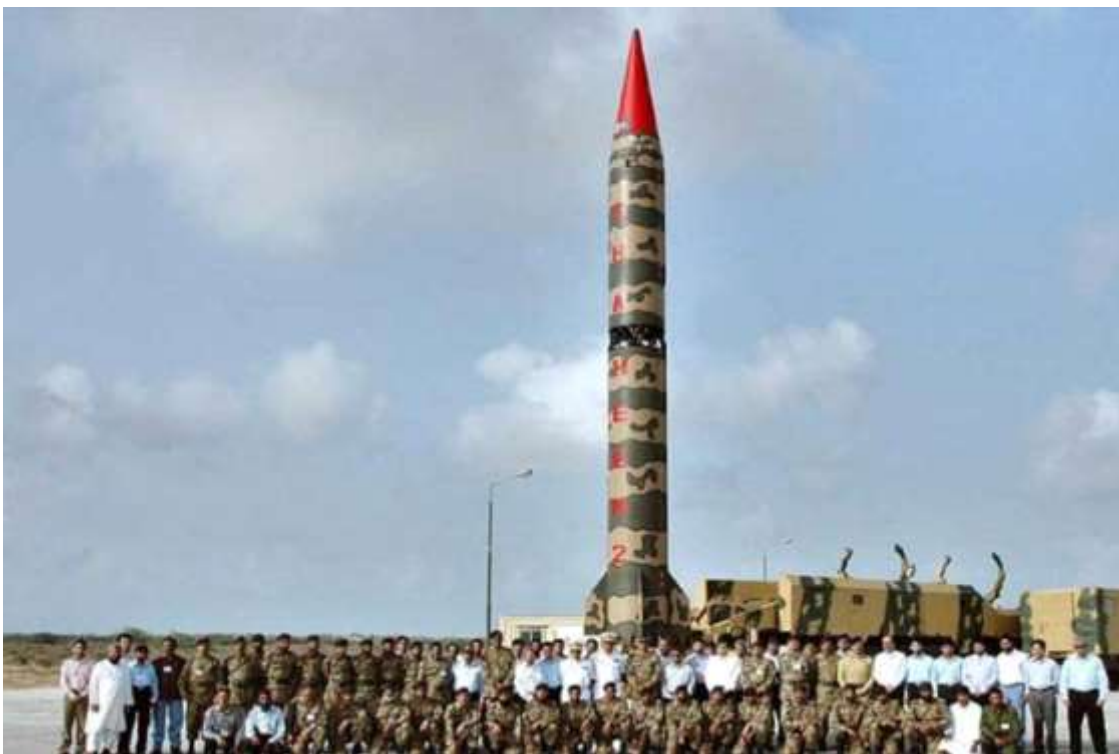
Фото в свободном доступе

Имеется также и ряд жидкостных ракет Гаури 1-3. Но они отличаются низким коэффициентом боевой готовности, длительной процедурой подготовки к пуску из-за невозможности хранения ракет в заправленном состоянии.