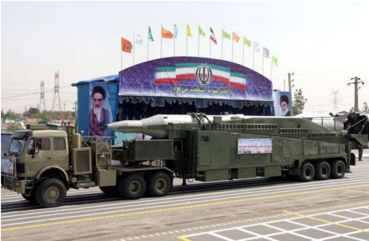
Фото в свободном доступе

БРСД Саджил-2 на мобильной пусковой установке. Одна, вместе с Имад, из наиболее, продвинутых.