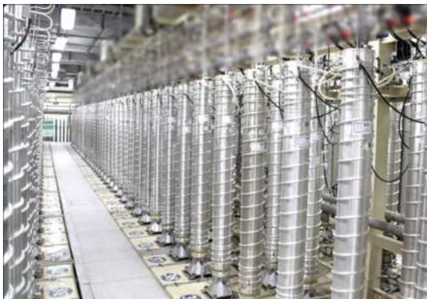
Фото в свободном доступе

Но работающие центрифуги, так называемый «банк центрифуг» находятся на большой глубине, и их работа не приостанавливалась. Именно здесь и происходит обогащение урана.