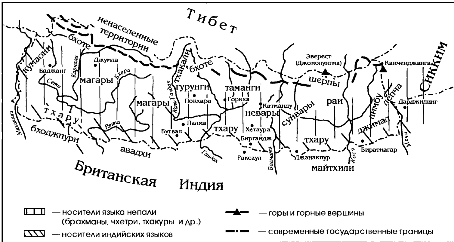
РАССЕЛЕНИЕ НАРОДОВ НЕПАЛА НА РУБЕЖЕ XIX и XX в.