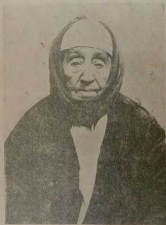
Бабушка евр. квартала в Самарканде; ей 95 лет.