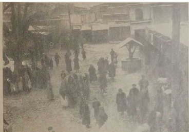
Еврейский базар в Самарканде.