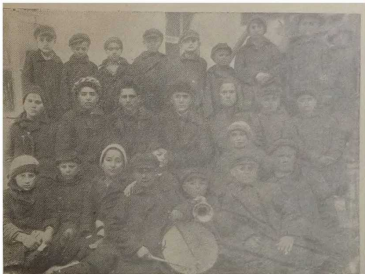
Отряд пионеров с руководителем.