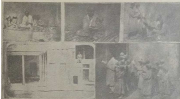
Старые еврейские школы.