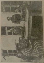
Женская трикотажная артель.