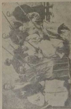
Туз.-еврейский национальный оркестр.