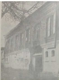
Еврейский клуб в Самарканде.