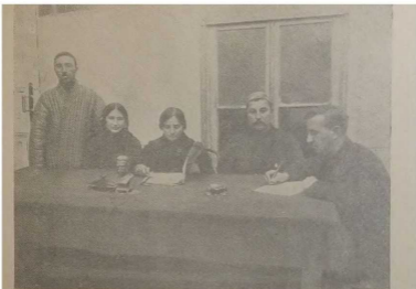
Еврейская камера нар. суда; судья—женщина.