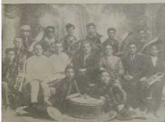
Музыкальный кружок туземных евреев.