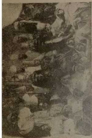
Туз.-еврейский театр по революции.