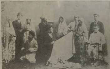
Туземно-еврейский театр после революции.