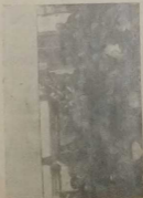
Еврей-земледельцы—репатисты С.Х. артель.