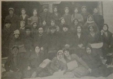
Женские курсы ликвидации неграмотности.