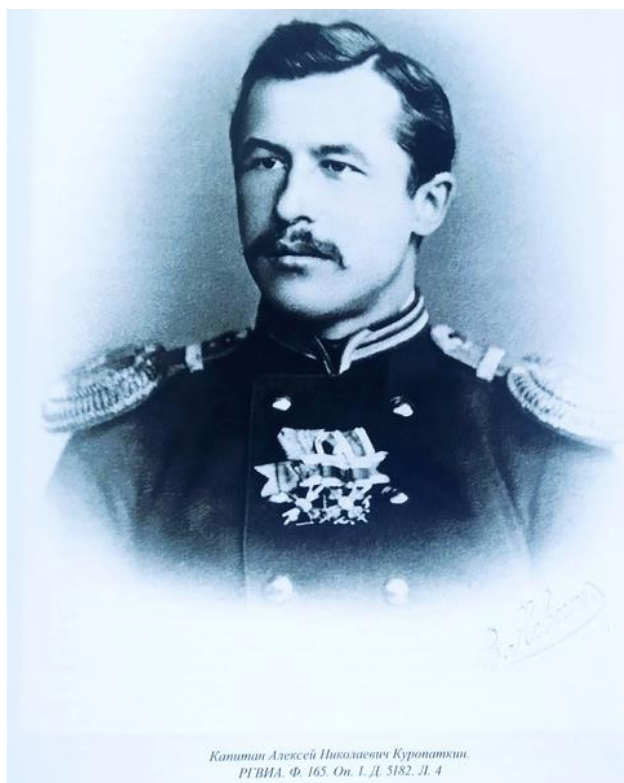
Капитан Алексей Николаевич Куропаткин.

Летом 1871 года штабс-капитан А. Н. Куропаткин уезжал в Академию Генштаба.