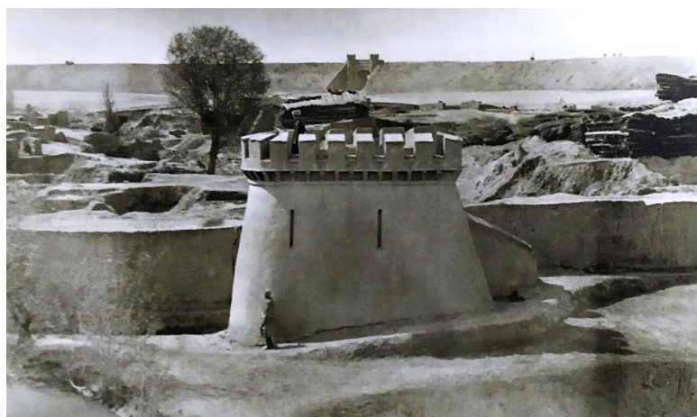
Сырдарьинская область. Крепость г. Ташкента