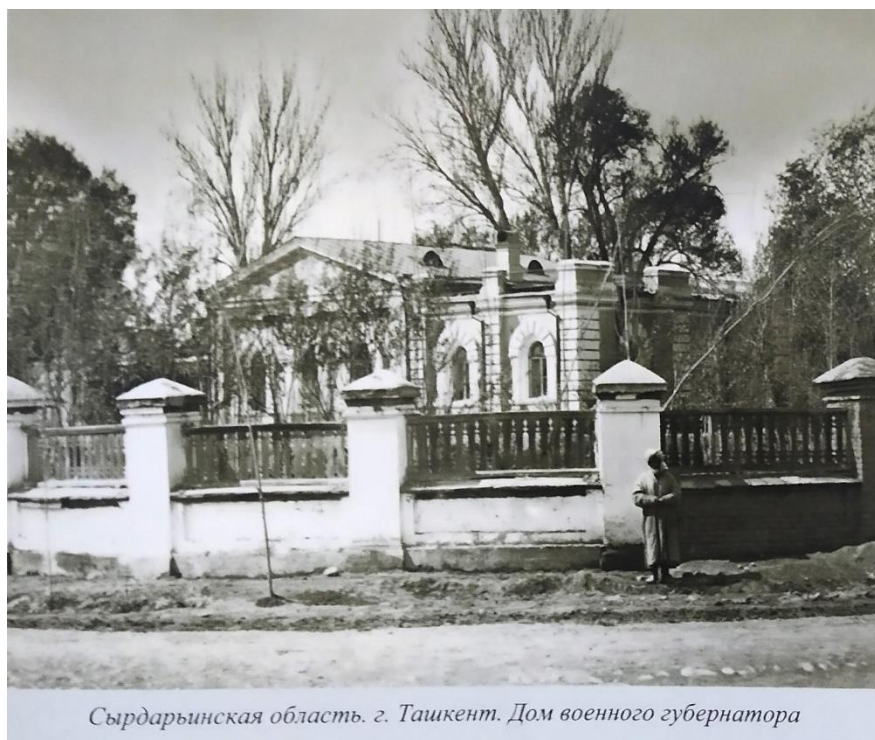
Сырдарьинская область. г. Ташкент. Дом военного губернатора

Коляска была только одна – у генерал-губернатора. На бал к нему и на приемы ездили на высоких сартовских крытых арбах, устланных коврами и подушками.