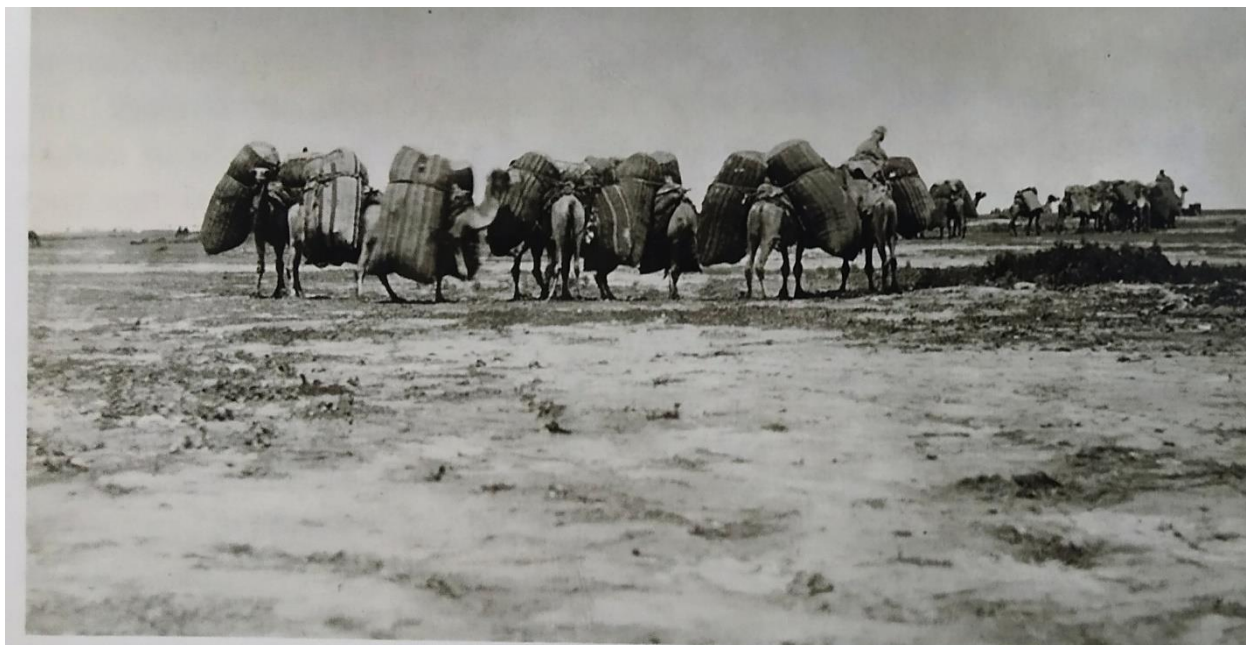
Сырдарьинская область. Караван