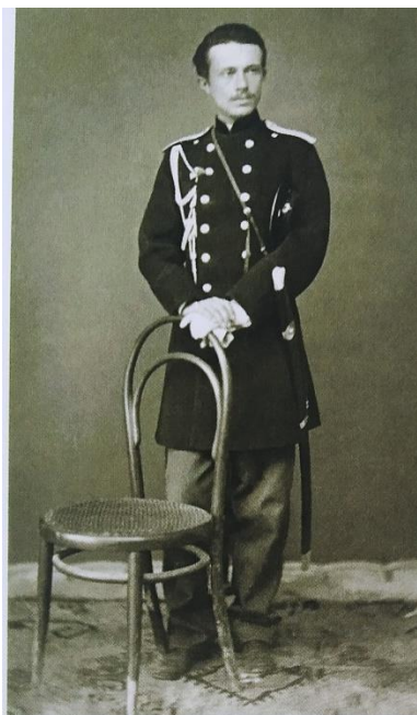
Полковник Генерального штаба Д. Н. Шауфус

Целый год я прожил в деревне и в конце июля 1870 года я получил письмо из Петербурга от полковника Генерального штаба Дмитрия Николаевича Шауфуса 1 , большого друга моего покойного брата Павла, поручившего ему привезти меня в Ташкент.