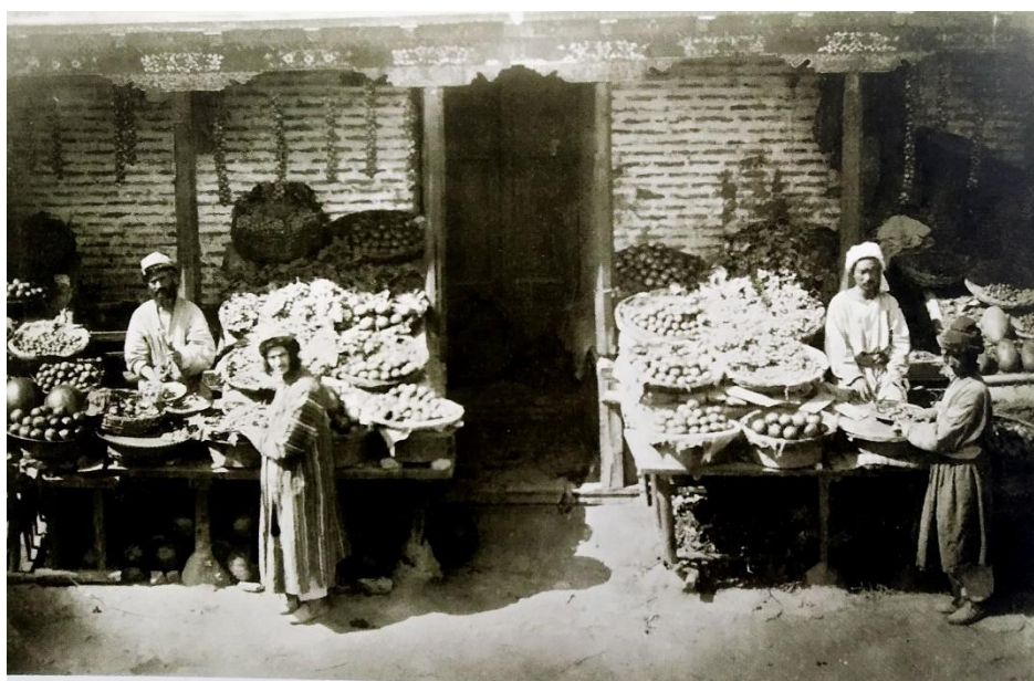
Мелочная торговля. Продажа фруктов. г. Ташкент