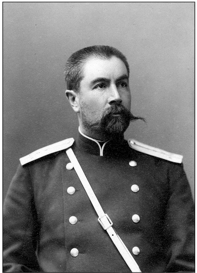
Штабс-капитан Б. Л. Громбчевский.

С этого момента в биографии Громбчевского начинается экспедиционный период, который