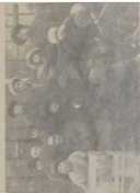
Трам брезлевой молодежи.