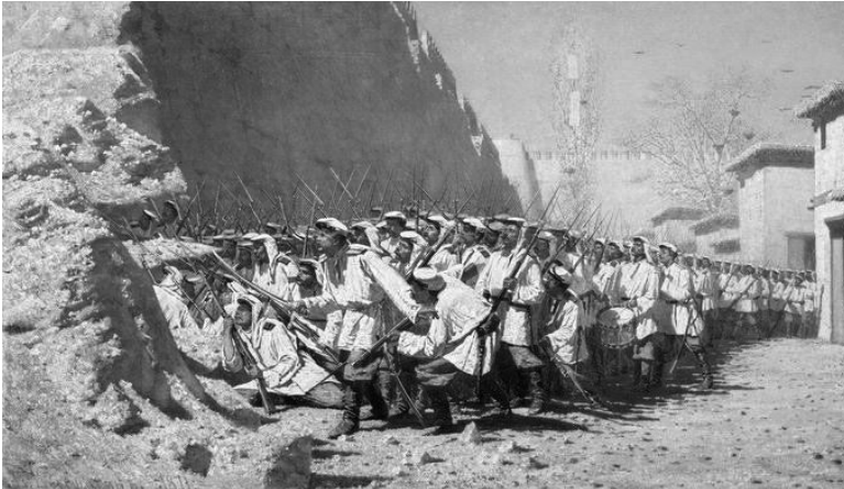
Картина В.Верещагина «Пусть Войдут» (1871), посвящена взятию Хивы.