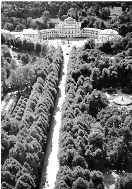
Павловск, дворцово-парковый ансамбль

Она была ровесница Николы, но повидала в своей жизни такое, чего он даже не смог бы себе и представить. Почти каждая женщина в любом мужчине видит как бы большое дитя, за которым надо следить и которое надо воспитывать. Она видела перед собой одинокого, неприкаянного человека, которому некому пожаловаться на свои обиды. Он порой слишком беспечно тратил деньги на ерунду. Он не следил за своим питанием, мог довольствоваться несколькими ломтями хлеба да парой стаканов чая. Эта привычка осталась с детских пор, когда, не дожидаясь