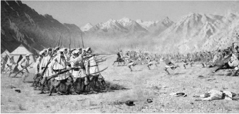
Картина Василия Верещагина «Нападают врасплох»

с нашими пикетами. Иногда их джигиты (туркмены, самые отчаянные) выезжали вперед и, подъехав к нашим шагов на 400, стреляли и быстро скакали назад. Некоторые из них попадали от бердановских выстрелов. Всю ночь стреляли они по нашему лагерю. Пули летали через голову. Странно мне было слышать их свист и, признаюсь, сердце билось сильнее.