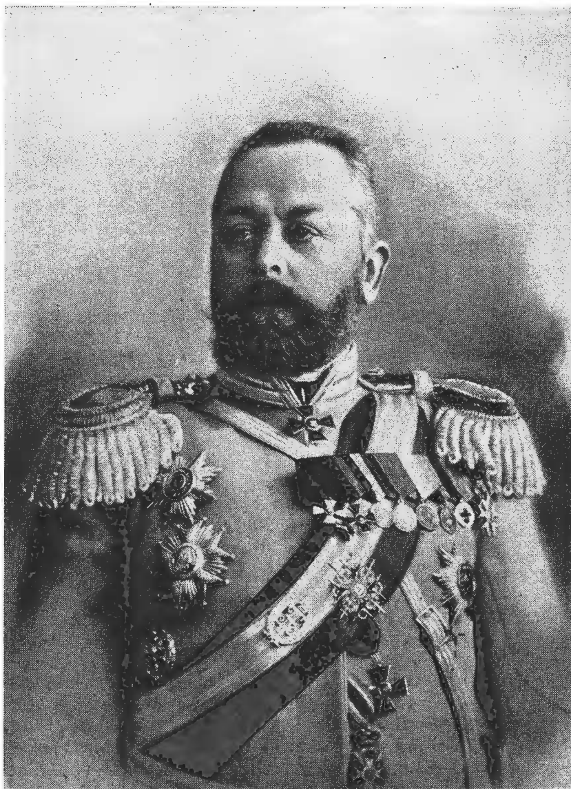
Генералъ А. В. Самсоновъ.