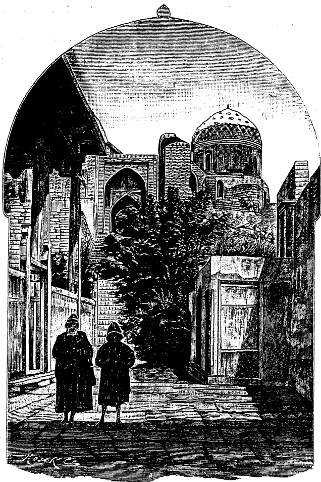
Мечеть Шахъ-Зейзе въ Самаркандѣ.

не пустили къ себѣ бѣжавшихъ съ поля битвы бухарцевъ, а на другой день прислали къ намъ по-