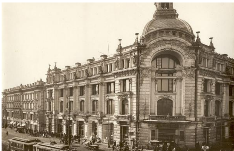
Гостиница “Дюссо”, последнее пристанище Скобелева. Старинная фотография.

Подал мне последнюю газету и рассказал о том, что говорят в столице, что будто Скобелева отравили”.