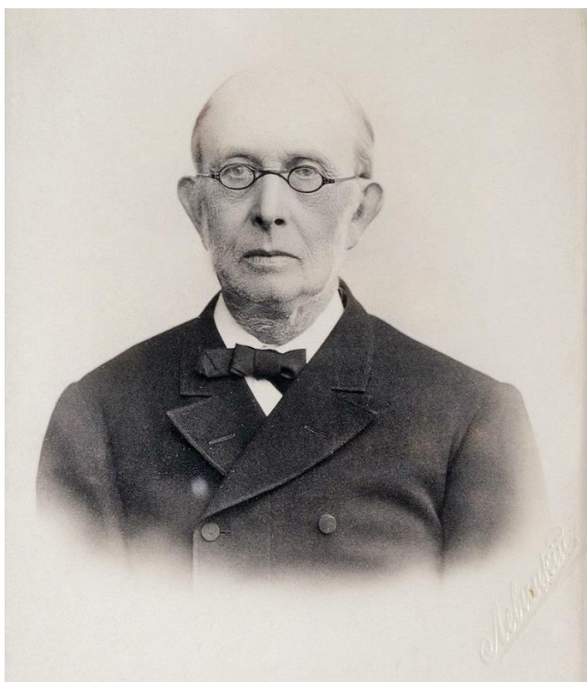
Обер-прокурор Святейшего синода К. П. Победоносцев.

Это был уже откровенный вызов. Бисмарк в ярости, а министерство иностранных дел России, вынуждено дезавуировать Скобелева, назвав его речь “частным заявлением лица, не уполномоченного на то правительством”. “Белого генерала” вызывают в Петербург, на всякий случай приказав ехать, минуя Берлин, кружным путем — через Голландию и Швецию. По прибытии в столицу Скобелев был принят Императором Александром III. Причём неожиданно для всех - и, особенно, для самого виновника скандала, - принят весьма благосклонно. Во-всяком случае Скобелев вышел оттуда весёлым и довольным. Два часа длилась аудиенция. О чём шёл разговор неизвестно, Скобелев никому об этом не рассказал. Благосклонность императора объясняется, по всей видимости, влиянием на царя К. П. Победоносцева, воспитателя Александра III, человека крайне реакционных взглядов, ставшего по сути серым кардиналом при российском самодержце.