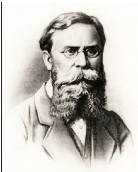
П. Л. Лавров. Фото неизвестного мастера. Париж, 1870 г.

Петр Лаврович, этот крупный философский ум и теоретик революции, в делах практики и революционной политики оказывался часто настоящим ребенком. Он наотрез отказался от предлагавшегося ему свидания, и так как в ту минуту в Париже не оказалось никого из достаточно компетентных и осведомленных революционеров (народовольцев), которым он мог бы сообщить о полученном им предложении, – на этом и кончилось дело. Впоследствии, в 1885 г., мне пришлось говорить с Петром Лавровичем об этом инциденте и выразить сожаление, что Лавров отклонил подобное свидание и не использовал такой благоприятный случай.