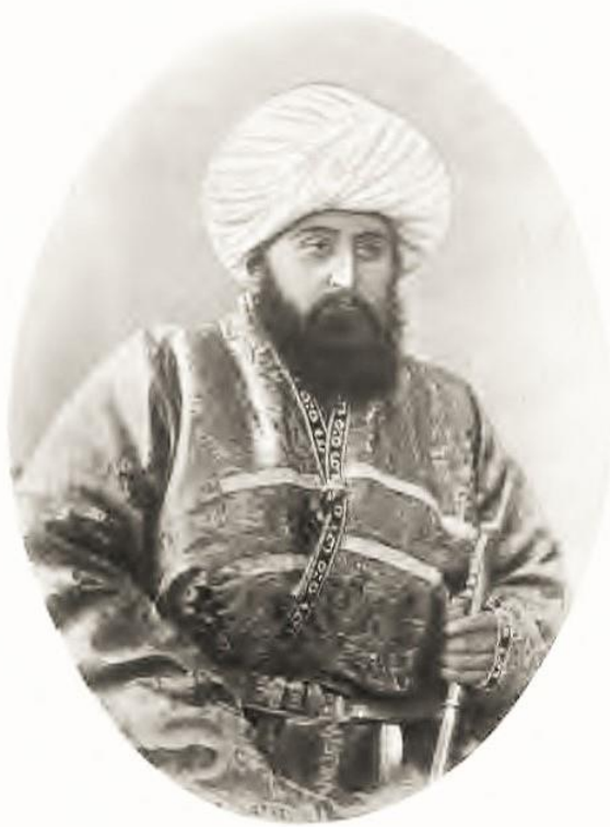
ЭМИРЪ БУХАРСКІЙ МИРЪ-СЕЙДЪ-АБДУЛЪ-АХАДЪ.

Узнав о кончине своего диван-беги, эмир написал безутешному отцу Мехмед-бию сочувственное письмо в котором отметил, что никогда не смотрел на своего первого министра как на слугу, а только как на старшего брата и что теперь сделает всё, чтобы заменить ему сына.