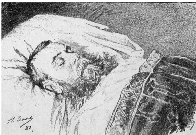
М. Д. Скобелев на смертном одре. Рисунок Николая Чехова

Похороны Скобелева вылились в демонстрацию грандиозной народной скорби. Тело героя набальзамировали и положили в гроб в парадном генерал-адъютантском мундире.