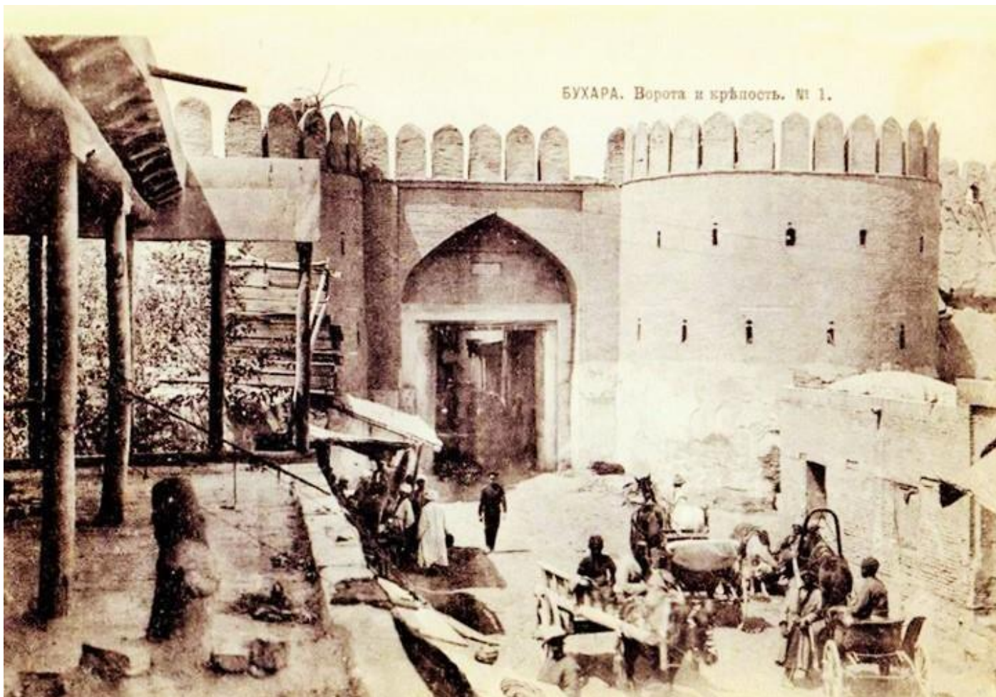
Каршинские ворота Бухары. Старинная открытка.

Увы, не было своего Шекспира в благословенной Бухаре, чтобы живописать дворцовые интриги, перевороты, таинственные убийства и казни, происходившие в этом государстве на всём протяжении его существования.