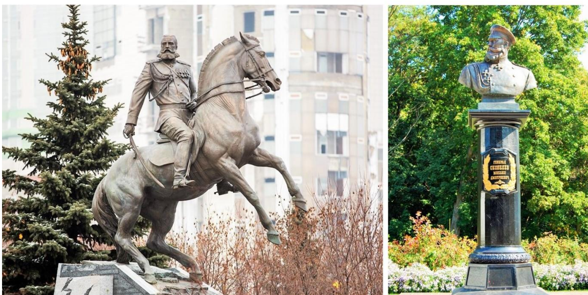
Памятники М. Д. Скобелеву в Москве (2014 г.) и Рязани (2007 г.)

В Болгарии памятники Скобелеву сохранились. Появились они и в современной России. В Москве, перед зданием Генерального штаба, возвышается фигура «Белого генерала» на вздыбленном коне, а в Рязани установлен бюст героя.