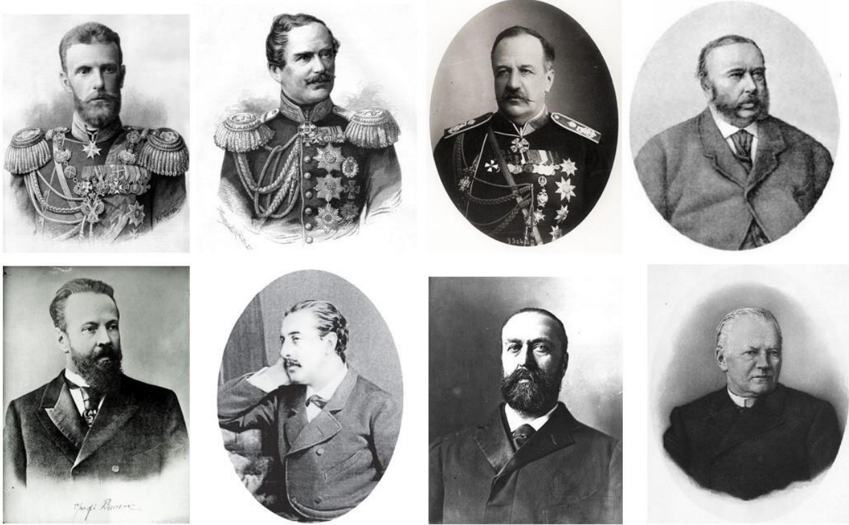
Руководители “Священной дружины”. Верхний ряд: Великий Князь Сергей Александрович, московский генерал-губернатор В. А. Долгорукий, генерал И. И. Воронцов-Дашков, Р. А. Фадеев. Нижний ряд: С. Ю. Витте, П. П. Демидов (Сан Донато), А. Г. Щербатов, министр государственных имуществ М. Н. Островский

В неё вошли и другие высокопоставленные лица, близкие ко двору, даже некоторые из великих князей. Для руководства черновой шпионской работой был приглашен бывший сотрудник III Отделения генерал В. Н. Смельский, оставивший интересный дневник. Тогда же в столице, в доме графа П. П. Шувалова, Витте принёс присягу в верности этому сообществу. Он был назначен главным правителем “дружины” в Киевском районе. По примеру масонских лож были придуманы шифры и тайные знаки, чтобы члены дружины могли распознать друг друга. Организация имела русскую и зарубежную агентуру, устраивала провокации, стремясь сбить с толку революционеров и посеять недоверие их друг к другу. По её распоряжению Витте, например, ездил в Париж для организации покушения на известного народовольца Л. Н. Гартмана, а также принимал участие в составлении некоторых изданий охранительного порядка. “Священная дружина” насчитывала 729 членов и имела ряд отделений в провинциях: Харькове, Киеве, Нижнем Новгороде и других городах.