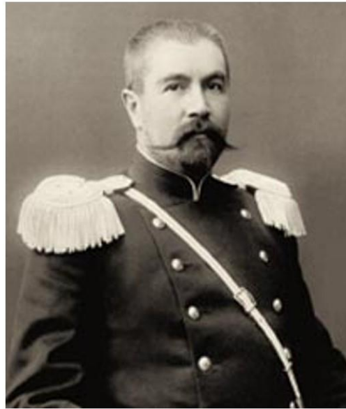
Курманджан-датка, портрет неизвестного художника, 1908 г. и Б. Л. Громчевский, начальник Ошского уезда (1893 – 1895) фотопортрет из коллекции Библиотеки Русского географического общества

Алимбек, дослужился до должности визиря при Кокандском хане и во время его частого отсутствия Курманжан становилась фактической правительницей Алая. В 1862 году правитель алайских киргизов погибает от рук заговорщиков, и его вдова полностью берёт бразды правления родом в свои руки.