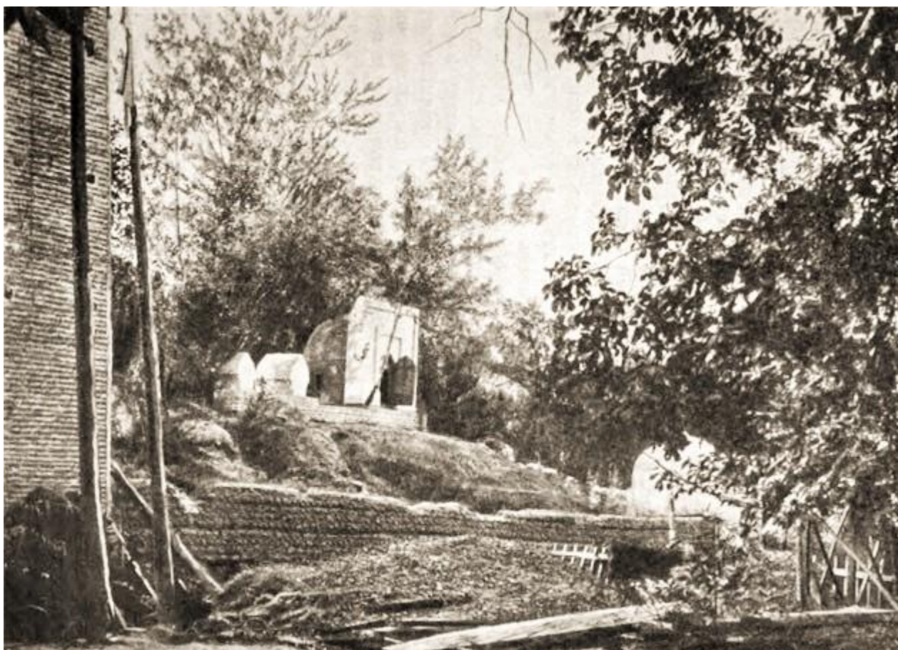
Мои́ла казнённого Камчибека и место погребения его матери.

В октябре 1893 года в Гульчинской волости Ошского уезда пропал таможенный разъезд. Сразу четыре человека – запасной унтер-офицер Боровков и три киргиза-стражника выехав на патрулирование приграничной зоны исчезли, словно растворились в воздухе. Это вызвало немалое беспокойство как у администрации Ферганской области так и у недавно назначенного управляющим Ошского уезда подполковника Бронислава Громбчевского. Несмотря на многодневные поиски и расспросы местного населения пропавших найти не удалось.