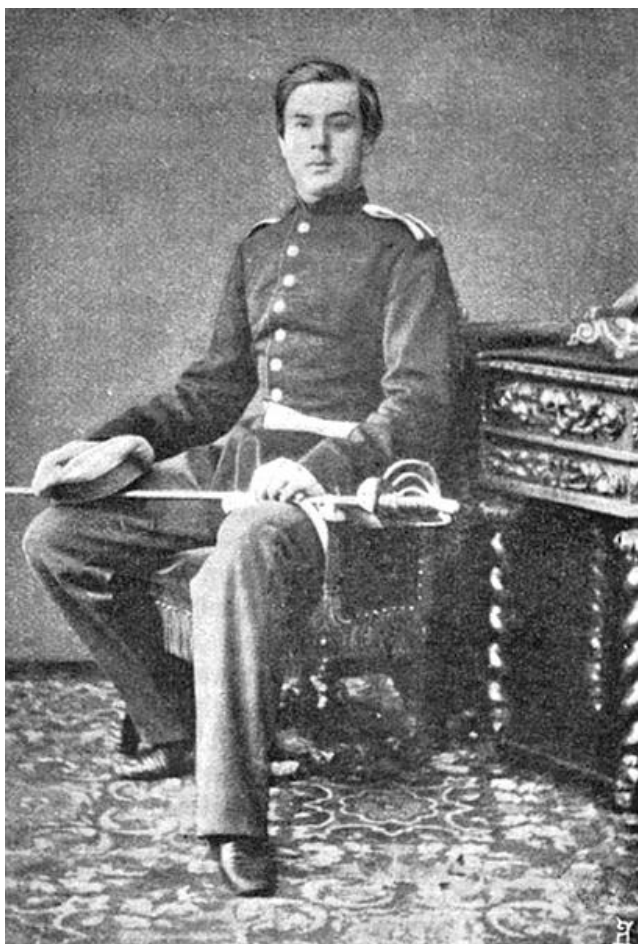
М. Скобелев-юнкер. Журнал “Разведчик”, июнь 1902 г.

После эпизода с гувернёром Михаил был отправлен отцом в пансион в Париж. Содержатель пансиона Жирарде, напротив, оказался для мальчика, не только воспитателем, но и другом, искренне привязавшимся к своему питомцу.