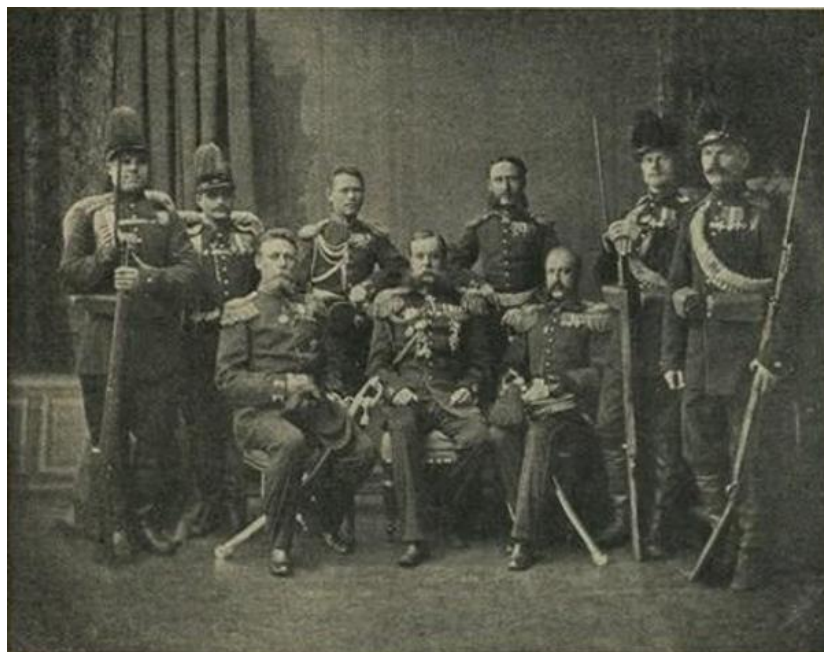
М. Д. Скобелев среди офицеров и нижних чинов «скобелевской» дивизии.