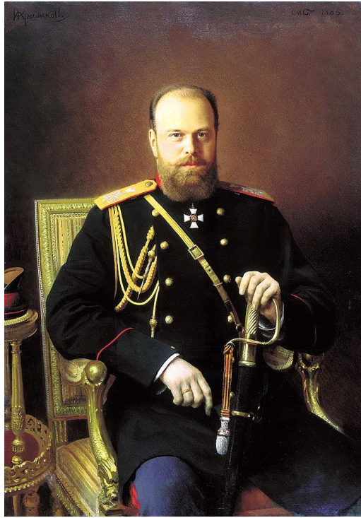
И. Н. Крамской. Портрет Императора Александра III