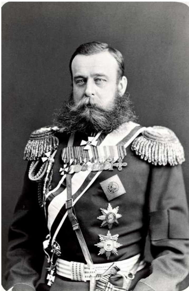
Михаил Дмитриевич Скобелев. 1881 г.