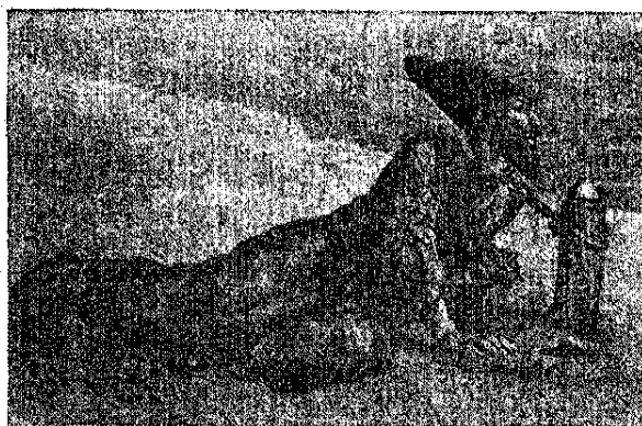
Пленный персианец в Хиве. Музей народов СССР.

Хераджные земли (третья категория мюльковых земель) предоставлялись государством в наследственное владение населявшим их мелким земледельцам с уплатой ими податей и повинностей государству (большую часть натурой — от \frac{1}{8} до \frac{1}{5} части урожая). Налог этот и по форме своей и по размерам приближался