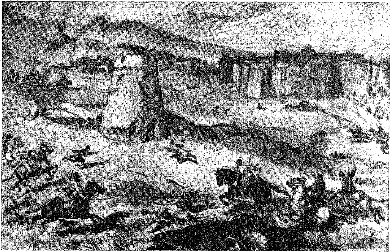
Набег туркмен. — Русско-персидская граница.