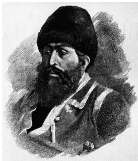
Шер Али-Хан. Эмир Авганский (1863–1879 гг.).

К середине XIX в. Великобритания, мощная промышленная держава с большим количеством колоний, служившим ей источником сырья и важным рынком сбыта ее товаров, попыталась поставить и Афганистан под свой политический и экономический