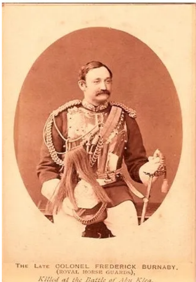
THE LATE COLONEL FREDERICK BURNABY, (ROYAL HORSE GUARDS), Killed at the Battle of Abu Klea.